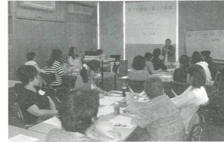
「神対応コミュニケーション術」

女性の再就職や自立支援に向けて、様々な取り組みを実施しています。定期的なセミナー開催で、仕事と家庭を両立させたい女性を支援しています。