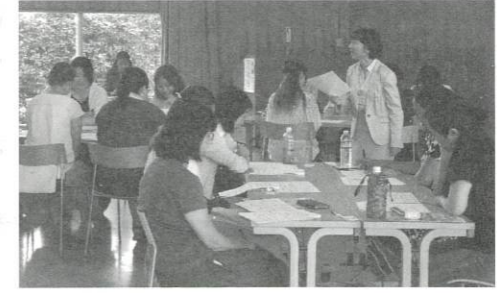
「効率的な求人探し方と注意点」