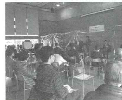
ハーモニーコンサートの模様

ハーモニー春日部を利用される登録団体の皆様に、男女共同参画に係る講座を開催し、男女平等について考える機会を提供しています。